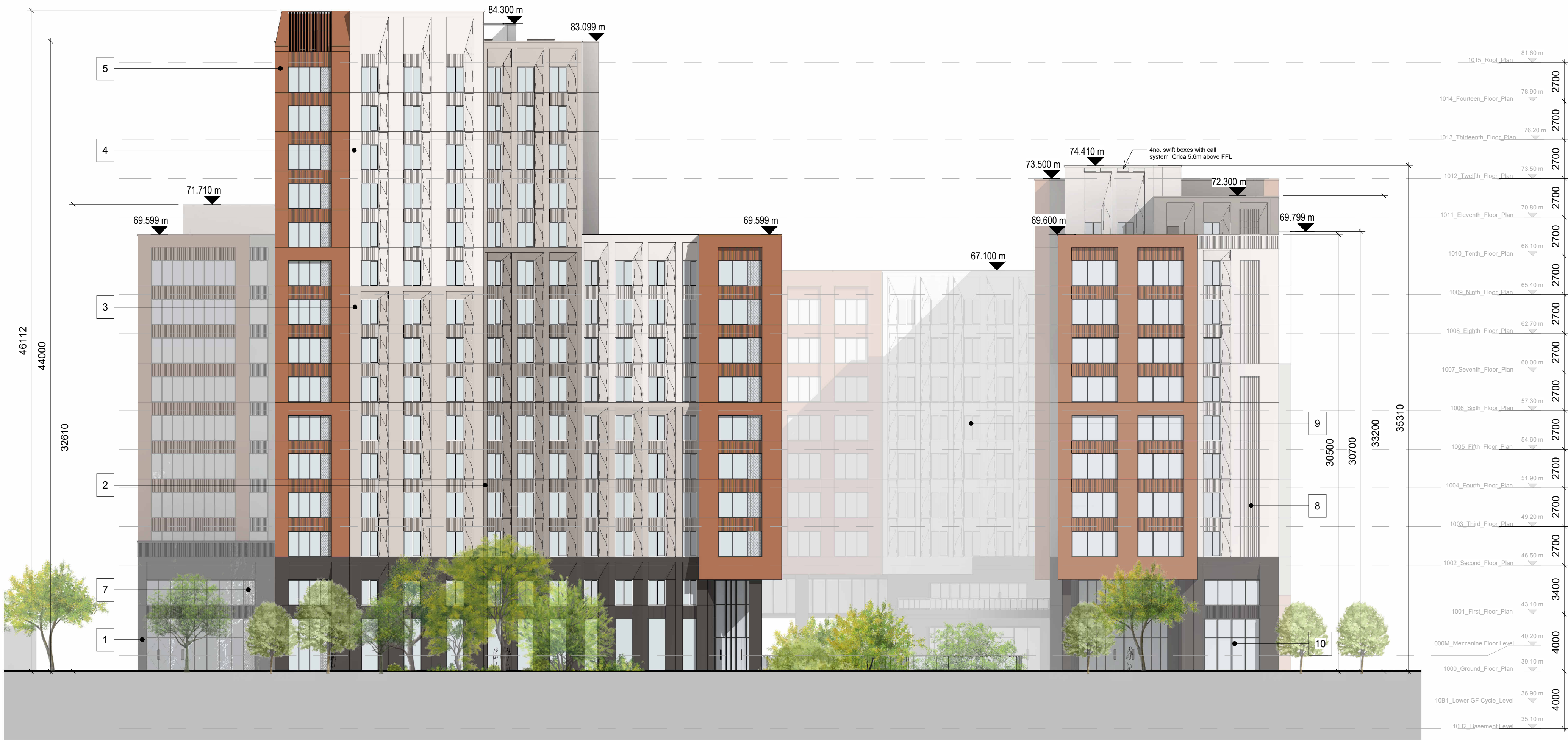
5 North Elevation 5 1 : 200