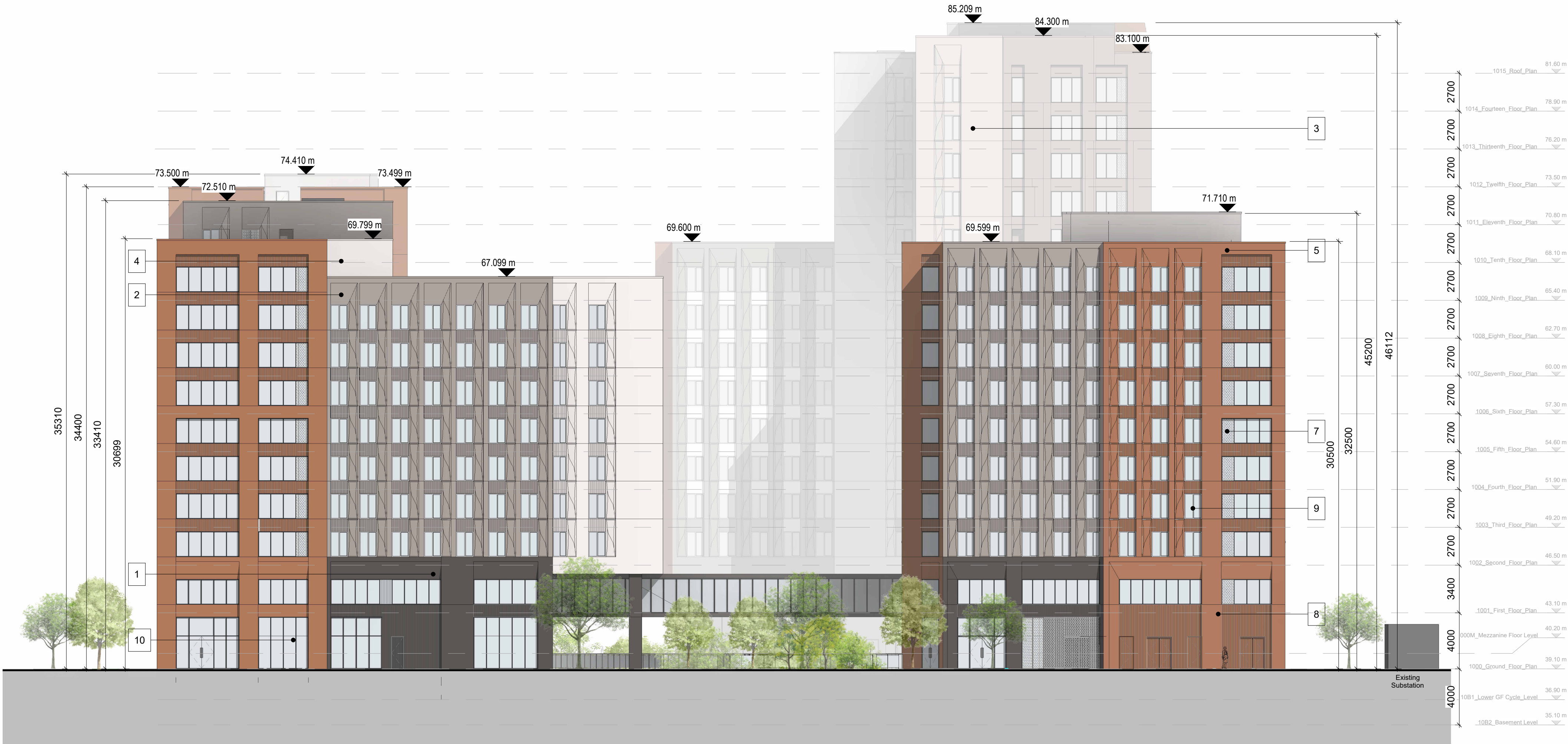
7 South Elevation 7 1 : 200